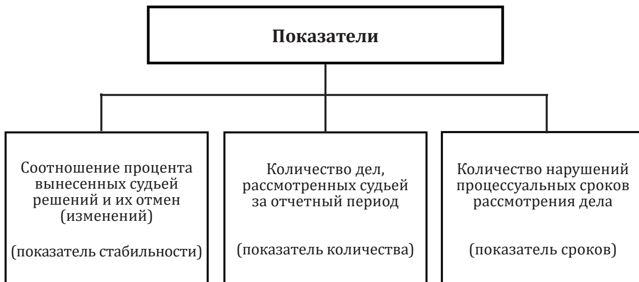
Рис. 1. Основные показатели количественного (статистического) подхода

Следует заметить, что количественный подход не предполагает возможности внедрения лишь одного показателя – стабильности выносимых судебных решений. Органами судебного сообщества могут быть разработаны иные показатели, объединенные одним признаком – числовая характеристика качества проделанной судьей работы. Например, в отечественной системе оценки качества правосудия, как правило, выделяют еще как минимум два таких показателя: показатель количества рассмотренных дел и показатель соблюдения процессуальных сроков (см. рис. 1).