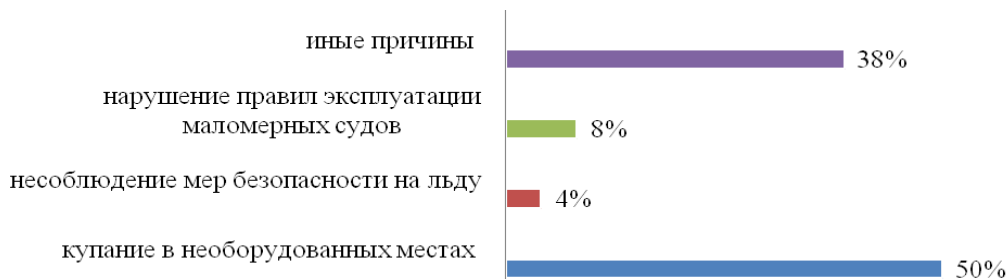
Рис. 1. Распределение происшествий на водных объектах Российской Федерации в зависимости от их причин, 2022 г. 2

Основной причиной гибели людей на водных объектах в летний период является купание в необорудованных местах, в зимний период – нарушение правил безопасности во время ледостава и ледохода (см. рис. 1).